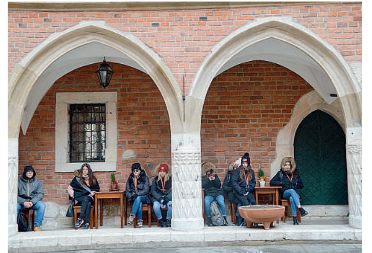
Il gruppo piacentino durante una tappa della giornata di ieri

Accompagnati da guide locali e formatori di Istoreo gli studenti hanno visto un pezzo di storia