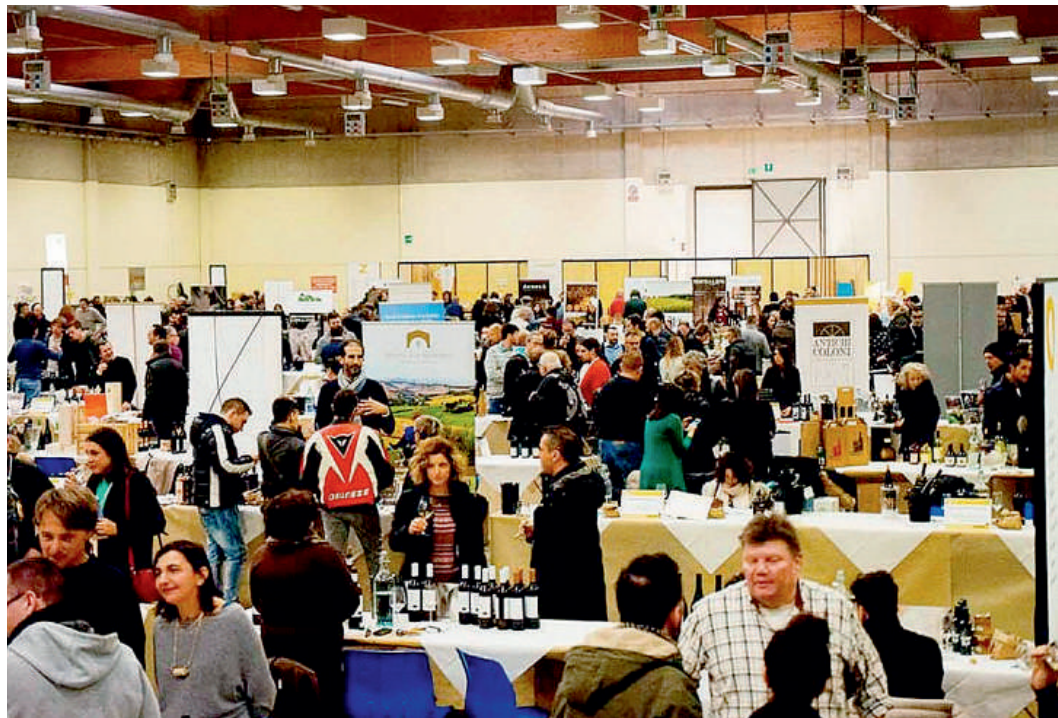
Un'immagine dell'edizione 2018 di Sorgentedelvin Live nei padiglioni di Piacenza Expo

Dal 9 all'11 febbraio 150 vignaioli provenienti da Italia ed Europa per un settore enologico qualificato e che non è più di nicchia