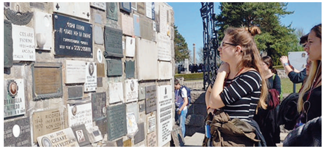
La visita dei ragazzi piacentini al Memoriale di Mauthausen

no girato per il paese, seguendo il percorso di esplorazione attraverso le baracche e gli edifici del kommando che non ci sono più, ma sono stati ben presenti nel racconto